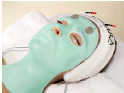
OCEAN MIRACLE IONISABLE MASK 3010